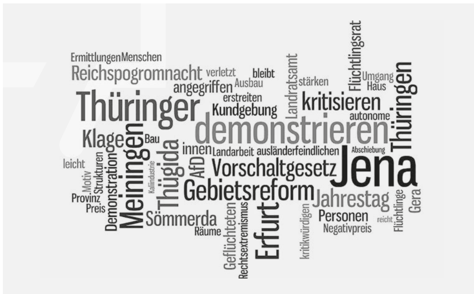
Abbildung 2: Die 50 häufigsten Wortnennungen (Kurzbeschreibung und Thema/Motiv), erstellt mit wordle.net

Die Wortwolke (vgl. Abbildung 2) veranschaulicht die thematische Vielfalt der zivilgesellschaftlichen Protestaktivitäten – auf Grundlage der bei der Erhebung eingegeben Kurzbeschreibungen und der wörtlich in den Artikeln benannten Protestmotive. Das Bild zeigt: Die Thüringer Zivilgesellschaft ist tatsächlich in Bewegung.